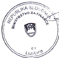
Franc Križanič Dr. Franc Križanič MINISTER