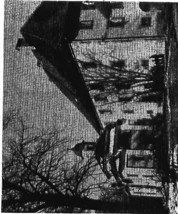
Baročni dvorec na Kodeljevem (grad: krej je dobil ime po graščaku)

Na programu so obsežna komunalna dela, graditev predvsem stano- vanjskih hiš, dalje mostu čez Ljubljaničo, ureditev športnega parka itd. Vsa ta dejavnost bo bistveno posegla v podobo naselij naše občine. Ne- dvomno zaradi nje ne bodo v nevarnosti kulturni spomeniki prvega reda, kakršni so n. pr. grad na Kodeljevem, na Selu ali na Fužinah, padla pa bo ta ali ona kmečka hiša, ker se mesto pač širi, iz zaostalega predmestja pa se poraja urejeno naseleje.