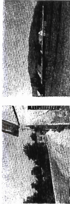
Zaloka cesta, vzhodni del — kozoletci v ozadju kmečkoga dela Zaloške ceste

Istovetnost razvoja Zaloške ceste pa zaman iščemo v zahodnem nadaljevanju ceste od Sela proti Ljubljani. V tem delu se cesta močno razlikuje od doslej opisanega dela. Vzhodni del je bil pri graditvi do leta 1900 navezan sam nase, to se pravi, da so nove stavbe gradili prebivalci — kmetje, pri čemer so imeli neruralni momenti le najmanjši vpliv. Vpliv mestnega aglomerata in njegovega življenja se tako rekoč ne čuti in zato ostane ta del Zaloške ceste po svoji funkciji še nadalje