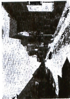
Bernčekova ulica — Vodmatska ulica

kmečki. Drugačen pa je bil razvoj v zahodnem delu v smeri povezovanja z Ljubljano, kar vidimo po eni strani že v delno strnjeni zazidavi. Stavbe, četudi prav tako kakor v vzhodnem delu po veliki večini pritične, niso namenjene le za stanovanja ali kmetijske potrebe, marveč so jih delno že, ko so jih gradili, namenili tudi n. pr. za obrt ali manjše prodajalne. Reči moremo, da sta bila na Zaloški cesti že okrog leta 1900 dva funkcij-sko različna dela; vzhodni čisto kmečki in zahodni, kjer se kmečki element prepleta že z drugimi, n. pr. z obrtniškim.