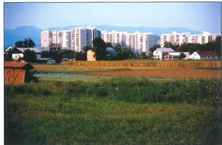
Hruševsko polje in Nove Fužine. Ali bomo tudi to polje »ososeskali«? (Fotografija M. Gabrovec).

Pri ocenjevanju bodoče prebivalstvene velikosti Ljubljane je potrebno izhajati iz tega, da je Ljubljana eno od možnih regionalnih evropskih središč z zelo ugodno geografsko lego in s tem tudi z možnostmi hitrega razvoja. Hkrati pa je Ljubljana tudi prestolnica Slovenije, države z le dvema milijonoma prebivalcev, kar pomeni, da ne more postati »milijonsko« mesto, v kolikor hočemo imeti v Sloveniji kolikor toliko skladen regionalni razvoj in obdržati morebitno priseljevanje prebivalstva v razumnih mejah.