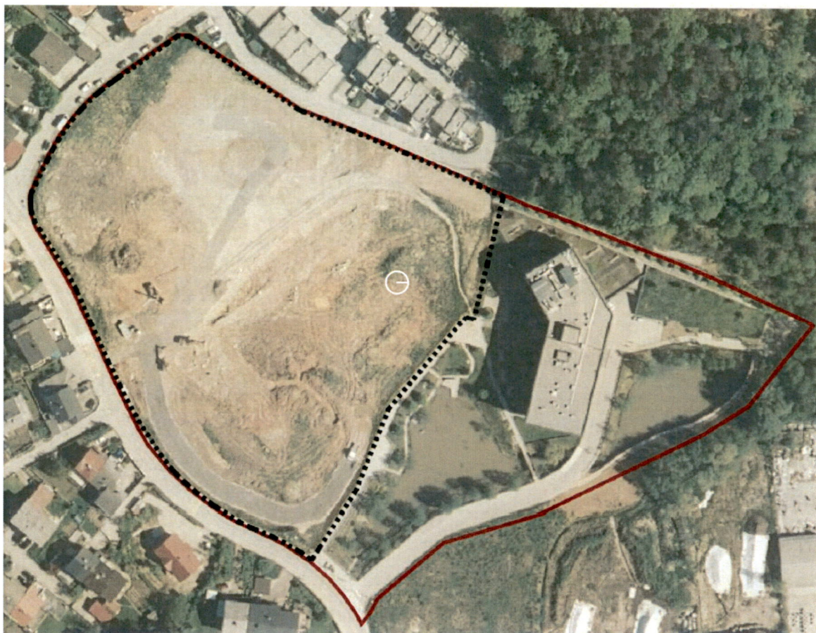
Prikaz območja OPPN in območja lokacijske preveritve na aerofoto posnetku