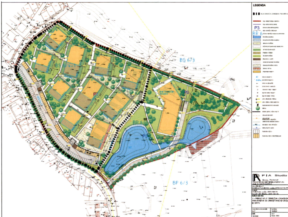
Izsek iz OPPN s prikazom meje območja lokacijske preveritve (črna črtkana obroba)