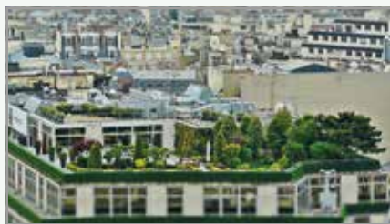
Primer vrta na strehi; Vir: https://pixabay.com/en/roof-terrace-roof-garden-1423897/

Bežigrad je ena izmed 17 četrtnih skupnosti v Ljubljani. Nekateri deli Ljubljane so bolj zeleni, drugi manj. Upam si trditi, da je Bežigrad eden izmed tisti, kjer je zelenih površin malo. Bežigrad šteje okoli 34.000 prebivalcev, torej je poseljenost visoka, in po številu prebivalcev bi lahko imeli že svoje mesto. Izmed vseh četrtnih skupnosti naj bi imela zgolj Šiška malenkost večje število prebivalcev (spletna stran MOL, podatki z dne 1. 1. 2017). Vendar ima Šiška veliko prednost pred Bežigradom, saj njeni prebivalci lahko obiščejo park Tivoli, Šišenski hrib in Rožnik. Bežigrad ima Severni park, ki naj bi se kmalu preimenoval v Park literatov, in pa nekaj posamičnih zelenih površin znotraj blokovskih naselij, npr. BS3, Savskega naselja in zeleno površi-