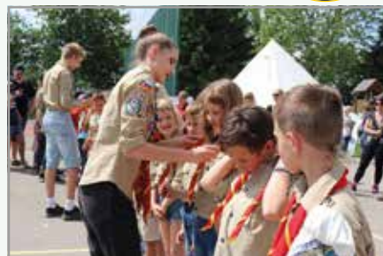
Praznovanja 65 let delovanja Društva tabornikov rod Bičkova skala

Vsi, ki nam želite pomagati pri tem čudovitem projektu, lahko to storite z SMS donacijo za 5 evrov - pošljite sporočilo z besedilom RBS5 na telefonsko številko 1919.