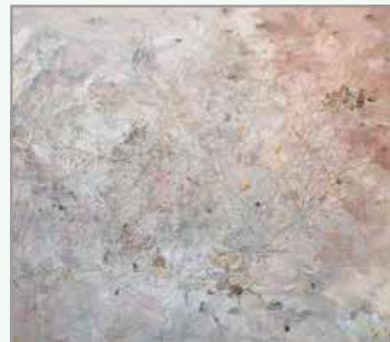
Maruša Šuštar, Zahodno od nas, 2009, olje na platnu, 130 x 190 cm