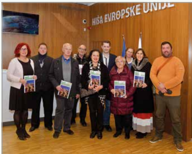
Članice in člani sveta ČS Bežigrad na obisku v Hiši EU