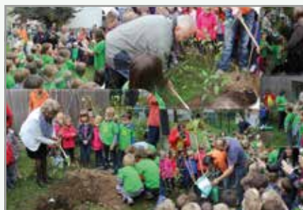
Delo na vrtu