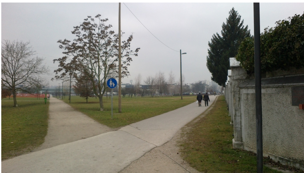
Potek Žalske ceste je danes sekundaren in služi Šmartinskemu parku