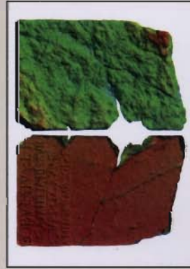
3D fotogrametrični digitalni model višine središnje in zadnje strani plošče (zdela: David Baumgartner)