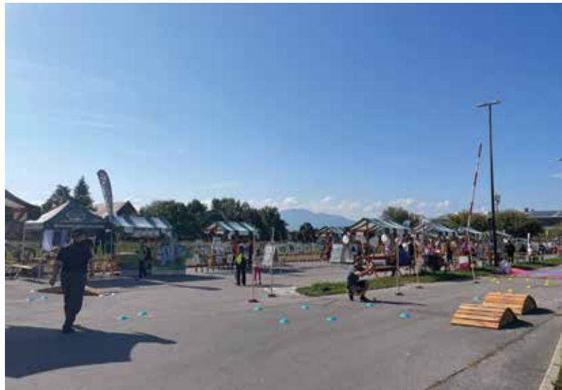
Dan ČS Rudnik

Poleg delavnic, dogodkov, čistilnih akcij, prireditev in tekmovanj, ki jih izvajajo naša društva skozi celo leto, program in urniki so objavljeni na spletni strani www.rudni-skacetrinka.si , v zavihku koledar dogodkov. Izpostavljamo tri velike dogodke, ki so zaznamovali poletje in jesen: Otroške barjanske žabarije, Gasilska veselica PGD Ljubljana Barje in Dan ČS Rudnik.