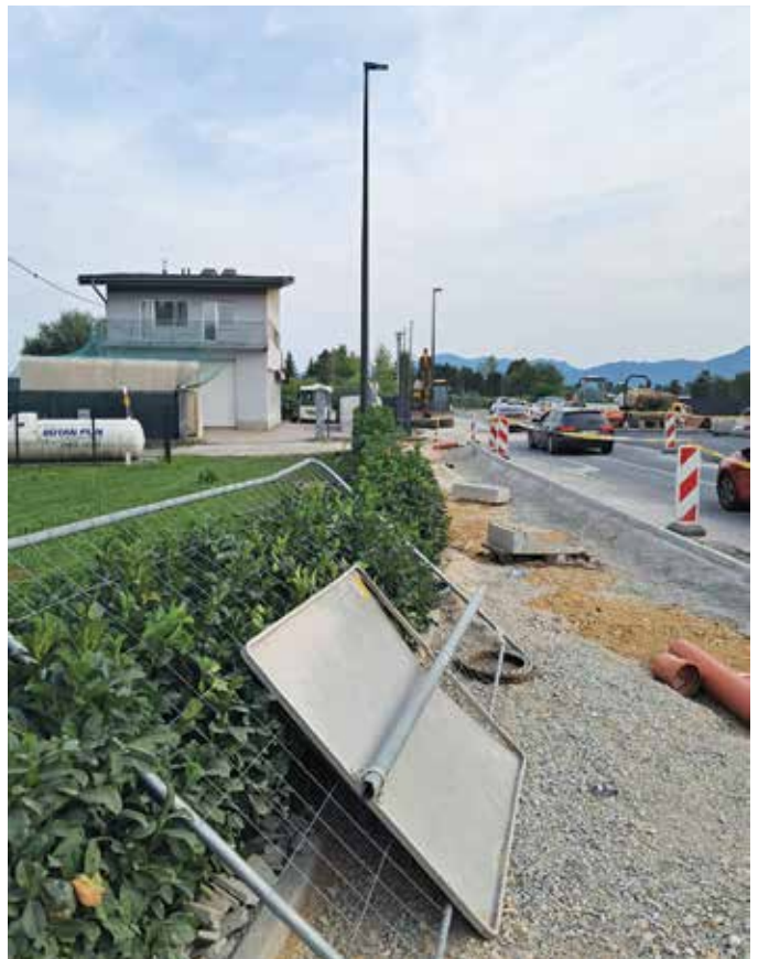
Prometni zastoji in obvozi bodo še nekaj časa naš vsakdan. Gradnja kanalizacije in druge infrastrukture.

V zadnjem letu in še malo smo tudi v ČS Rudnik občutili prometni kaos kot posledico zaprtja cest zaradi izgraditve komunalnega omrežja. Še nekaj časa bomo na cesti morali biti strpni, a nekaj novih cest je že urejenih, prav tako tudi novo križišče Ižanska cesta – Peruzzijska ulica – Črna vas, ki pomeni tudi dokončno ureditev Črnovaške ceste. Kmalu se bomo lahko vsi prepeljali po celotni prenovljeni Ižanski cesti z novim mostom, vseeno pa nas čaka še nekaj novih gradbišč. Vaša podpora in razumevanje sta pomembna, zato ostanimo strpni in potrpežljivi do vseh udeležencev v prometu in seveda tudi do izvajalcev del.