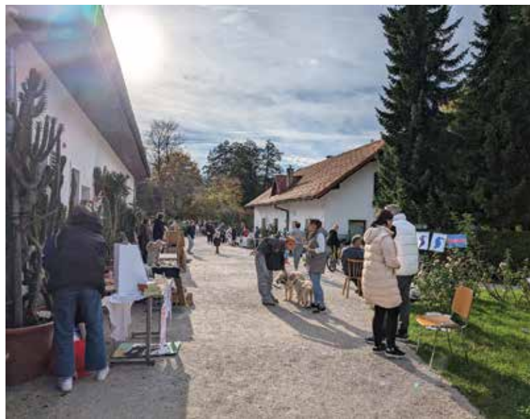
Ustvarjalni vrt, jesen 2024

Priložnosti za druženje in povezovanje med krajanji je bilo letos kar veliko. Trije sejmi so postali stalnica: kolesarski in smučarski sejem na OŠ Oskarja Kovačiča na Dolenjski cesti ter ustvarjalni sejem Ustvarjalni vrt v Botaničnem vrtu.