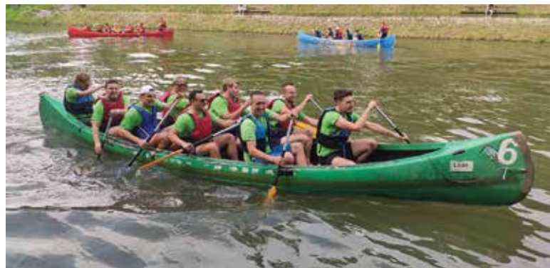
Zmagovalna ekipa Tekmovanja četrtnih skupnosti v velikih kanujih 2024

ČS Rudnik s krajanji in društvi sodeluje na različnih dogodkih v Ljubljani. Tradicionalno smo z dvema ekipama sodelovali na Tekmovanju četrtnih skupnosti v velikih kanujih. Obe ekipi sta se zagrizeno borili, je pa ekipa Krimovcev po lanskem drugem mestu letos dosegla svojo prvo zmago!