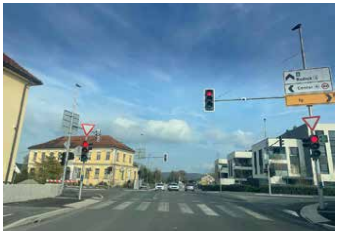
Gradnja križišča Ižanska-Peruzzijska-Črna vas