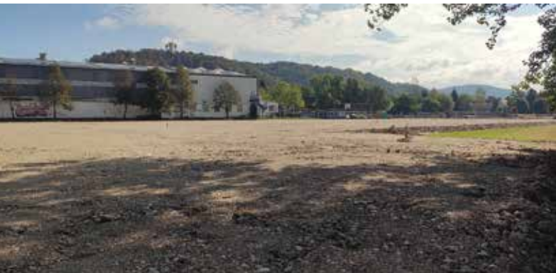
Gradnja nove enote Vrtca Galjevica

Poleg komunalne in cestne infrastrukture imamo še eno veliko gradbišče. Ob dvorani Krim se gradi nova enota Vrtca Galjevica, do naslednje jeseni pa bo na drugi strani dvorane, ob šoli, zgrajen tudi nov športni stadion, ta bo v šolskem času namenjen osnovni šoli, popoldan pa tudi vsem ostalim. Zelo blizu pa je tudi začetek gradnje novega četrtnega centra, Centra Barje.