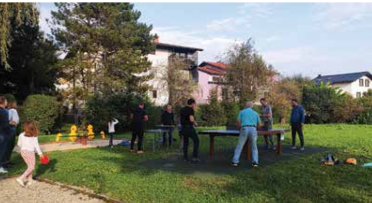
ETM - druženje ob namiznoteniški mizi na igrišču na Melikovi