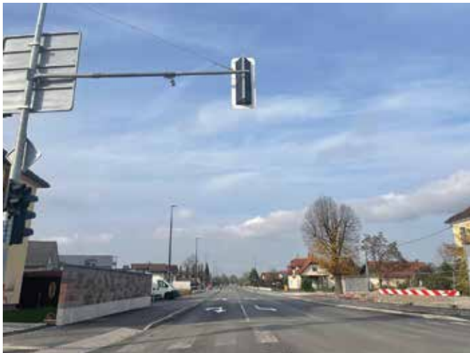
Prenovljen del Ižanske ceste

Poleg komunalne in cestne infrastrukture imamo še eno veliko gradbišče. Ob dvorani Krim se gradi nova enota Vrtca Galjevica, do naslednje jeseni pa bo na drugi strani dvorane, ob šoli, zgrajen tudi nov športni stadion, ta bo v šolskem času namenjen osnovni šoli, popoldan pa tudi vsem ostalim. Zelo blizu pa je tudi začetek gradnje novega četrtnega centra, Centra Barje.