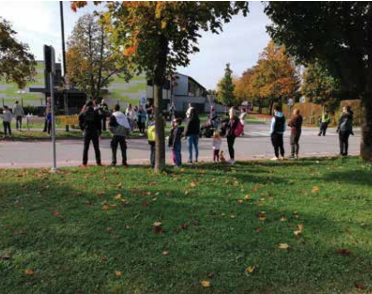
Navijaška točka LM-Oskar

Drugo uspešno sodelovanje pa je bilo na NLB Ljubljanskem maratonu, kjer se je ob trasi maratona, ki gre čez velik del četrtnske skupnosti, zbralo veliko navijačev, še posebej na dveh uradnih navijaških točkah - pri Oskarju pri dvorani Krim so navijali učenci in otroci iz vrtca, na drugi, pri Botaničnem vrtu, pa so organizacijo prevzeli svetniki ČS in krajanom. Zahvaljujemo se vrtcu, svetnikom in krajanom, ki so poskrbeli, da navijači niso bili lačni in so lahko zares dobro navijali.