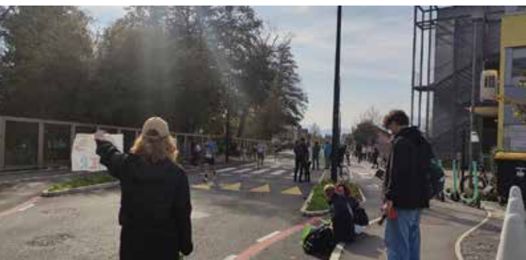
Navijaška točka LM-Botanični vrt

Poleg delavnic, dogodkov, čistilnih akcij, prireditev in tekmovanj, ki jih izvajajo naša društva skozi celo leto, program in urniki so objavljeni na spletni strani www.rudni-skacetrinka.si , v zavihku koledar dogodkov. Izpostavljamo tri velike dogodke, ki so zaznamovali poletje in jesen: Otroške barjanske žabarije, Gasilska veselica PGD Ljubljana Barje in Dan ČS Rudnik.