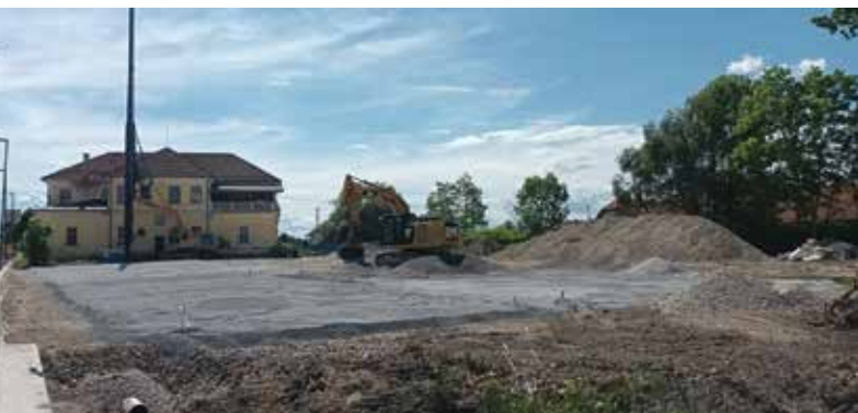
Bodoči Center Barje

Priložnosti za druženje in povezovanje med krajanji je bilo letos kar veliko. Trije sejmi so postali stalnica: kolesarski in smučarski sejem na OŠ Oskarja Kovačiča na Dolenjski cesti ter ustvarjalni sejem Ustvarjalni vrt v Botaničnem vrtu.