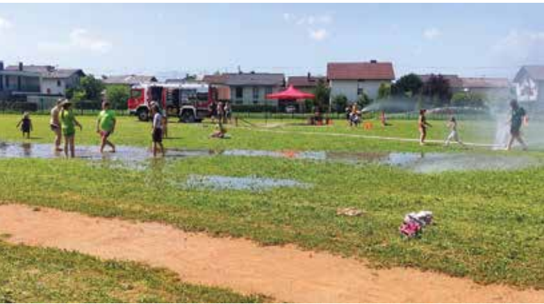
“Mlaka” na Žabarijah

Žabarije so potekale na eno najbolj vročih junijskih sobot, še dobro, da so gasilci poskrbeli za skoraj pravo mlako! Na gasilski veselici mlake ni bilo, je bila pa zabava kot že dolgo ne!