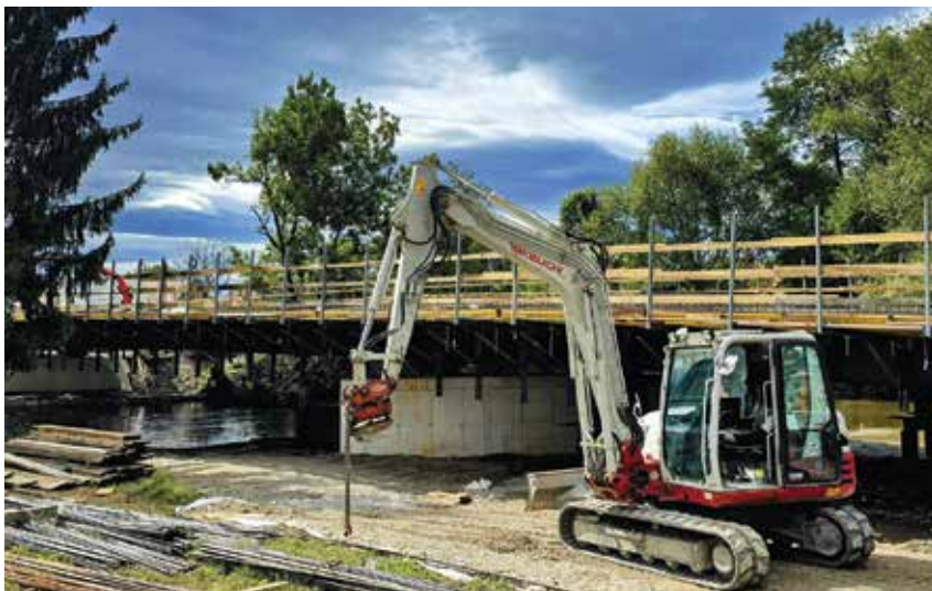
Gradnja novega mostu čez Ižico.

Le še par tednov nas loči od prižiga lučk in trenutka, ko bomo obrnili še zadnji list v koledarju tega leta. In ko bomo spisali nov seznam obljub za prihodnost. Naj bo na tem seznamu tudi zbirka malih dejanj, ki nas bodo še bolj povežala: potrckajte na sosedova vrata, če ga že dolgo niste videli in mu zaželite lep dan. Popihajte koleno malčku, ki mu je kolo odpovedalo poslušnost. In dvignite pogled od telefonskega ekrana in trgovki, ki vam vsak dan proda svež kruh, izrecite iskren hvala. Skupnost smo ljudje, ki nam je mar za ljudi okoli nas.