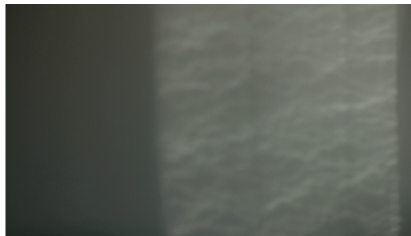
Trajanja, prisotnosti , video instalacija

V svoje videe je umetnica ujela trenutke mimobežnosti. V njih je sledila potovanju svetlobe in senc na zidovih svojega doma. Na prvi pogled gre za nepomembne, drobne trenutke, ki jih zlahka spregledamo. Ob tem umetnica ni posegla po intervencijah: ni dodala zvoka, videov ni časovno zgostila, ni zrežirala mizanscene. V videih na začetku še prepoznamo obrise konkretnih predmetov iz njenega domačega interierja, a se njihova oprijemljivost skozi trajanje videa počasi razblinja. Kot gledalci opazujemo počasi spreminjajočo se »sliko«, ki jo skozi dan na zidu ustvarjajo svetlobni snopi in sence. V kadru ni nobenih drugih ikonografskih nosilcev, še zlasti ne ljudi. V središču Tesine pozornosti se torej znajdejo obrobni, nestrukturirani, nekontrolirani vsakdanji pojavi, pri opazovanju katerih se ostri naša pozornost, krepki osrediščenost na »tukaj in zdaj« in zavedanje o popolnosti in minljivosti slehernega trenutka. Umetnica nam ne ponuja drame in velikih zgodb, odstre pa nam drobne trenutke, iz katerih je pravzaprav stkano naše življenje. Osredotoča se na svet, ki je zmeraj tu in se odvija vzporedno z našo vsakdanjo strukturirano rutino.