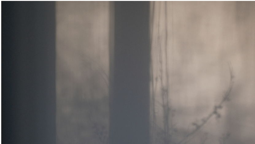
Trajanja, prisotnosti, video instalacija